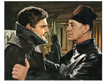
1965 LE DOCTEUR JIVAGO (Doctor Zhivago) de David Lean avec Omar Sharif