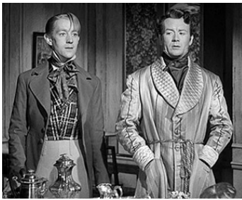
1946 LES GRANDES ESPÉRANCES (The great Expectations) de David Lean avec John Mills