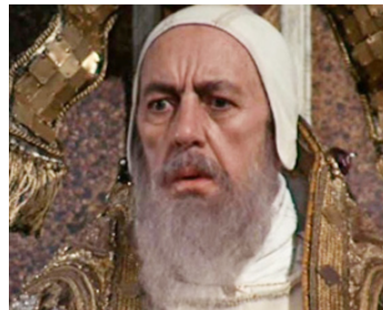
1972 FRANÇOIS ET LE CHEMIN DU SOLEIL (Fratello sole, sorella luna) de Franco Zeffirelli