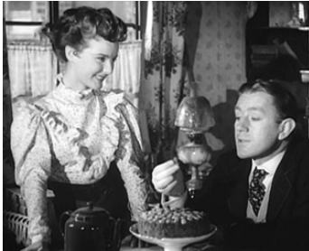
1952 TROIS DAMES ET UN AS (The Card) de Ronald Neame avec Petula Clark