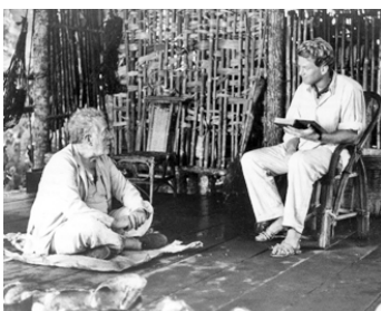
1987 UNE POIGNÉE DE CENDRES (A Handful of Dust) de Charles Sturridge avec James Wilby