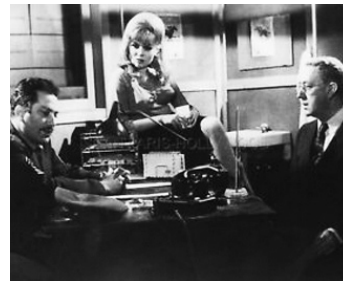
1964 SITUATION DÉSPÉRÉE... MAIS PAS SÉRIEUSE de G. Reinhardt avec Anita Höfer