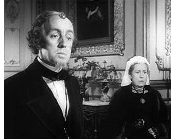
1950 LE MOINEAU DE LA TAMISE (The Mudlark) de Jean Negulesco avec Irene Dunne