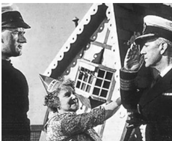
1957 IL ÉTAIT UN PETIT NAVIRE (All at Sea) de Charles Frennd avec Percy Herbert