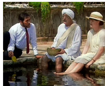
1984 LA ROUTE DES INDES (A Passage to India) de David Lean avec V. Bannerjee, Judy Davis