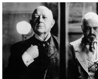
1991 KAFKA (Kafka) de Steven Soderbergh avec Brian Glover