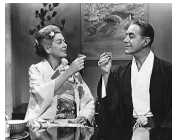
1961 LE GENTLEMAN EN KIMONO (A Majority of one) de Mervyn LeRoy avec Rosalind Russell