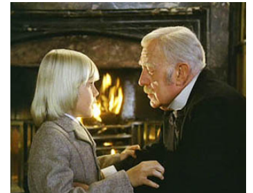
1981 LE PETIT LORD FAUNTLEROY (Little Lord Fauntleroy) de Jack Gold avec Ricky Schroeder