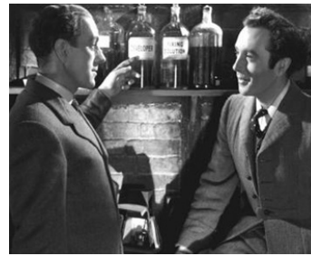
1949 NOBLESSE OBLIGE (Kind, Hearts and Coronets) de R. Hamer avec Dennis Price