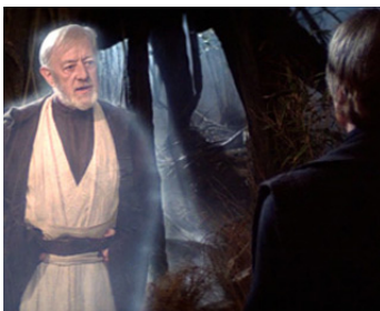
1982 LE RETOUR DU JEDI (Return of the Jedi) de Richard Marquand avec Mark Hamill