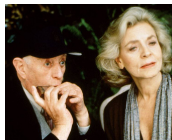
1992 UN CERTAIN JOUR DE JUIN (A foreign Field) de Charles Sturridge avec Lauren Bacall