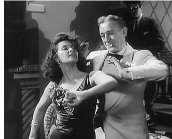
1953 CAPITAINE PARADIS (The Captain's Paradise) d'Anthony Kimmins avec Yvonne de Carlo