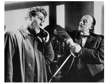
1949 DE LA COUPE AUX LÈVRES (A Run for your money) de Charles Frennd avec Donald Houston