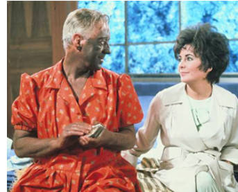
1967 LES COMÉDIENS (The Comedians) de Peter Glenville avec Elizabeth Taylor