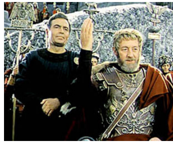
1963 LA CHUTE DE L'EMPIRE ROMAIN (The Fall of the roman Empire) d'A. Mann avec James Mason