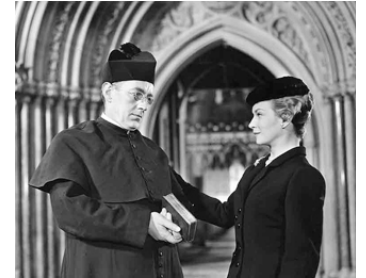
1953 DÉTECTIVE DU BON DIEU (Father Brown) de Robert Hamer avec Joan Greenwood