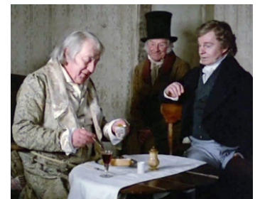
1986 LA PETITE DORRIT (Little Dorrit's Story) de Christine Edzard avec Derek Jacobi