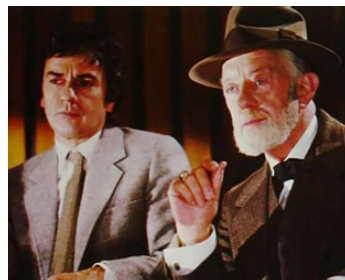
1983 LOVESICK (Lovesick) de Marshall Brickman avec Dudley Moore