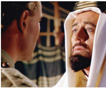
1962 LAWRENCE D'ARABIE (Lawrence of Arabia) de David Lean avec Peter O'Toole