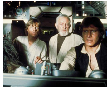
1980 L'EMPIRE CONTRE-ATTAQUE (The Empire strikes back) d'I. Kershner avec M. Hamill, H. Ford