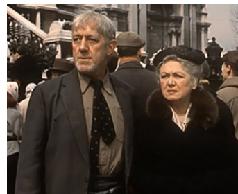
1958 DE LA BOUCHE DU CHEVAL (The Horse's Mouth) de Ronald Neame avec Renee Houston