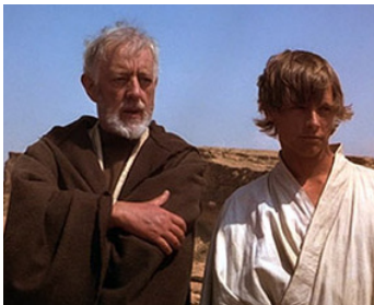
1976 LA GUERRE DES ÉTOILES (Star Wars) de George Lucas avec Mark Hamill