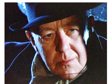
1995 TÉMOIN MUET (Mute Witness) d'Anthony Walker