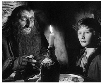
1947 OLIVER TWIST (Oliver Twist) de David Lean avec John Howard Davies