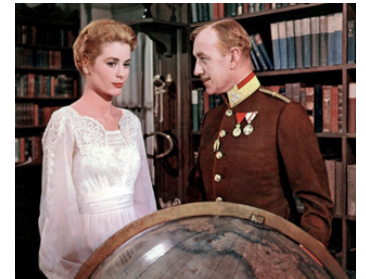
1956 LE CYGNE (The Swan) de Charles Vidor avec Grace Kelly