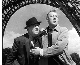
1951 DE L'OR EN BARRE (The Lavender Hill Mob) de Charles Crichton avec Stanley Holloway