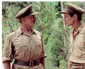
1957 LE PONT DE LA RIVIÈRE KWAÏ (The Bridge of the River Kwai) de David Lean avec James Donald