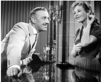
1954 DEUX ANGLAIS À PARIS (To Paris with Love) de Robert Hamer avec Odile Versois