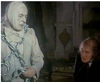
1970 SCROOGE (Mr Scrooge) de Ronald Neame avec Albert Finney