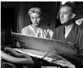
1959 NOTRE AGENT À LA HAVANE (Our Man in Havana) de Carol Reed avec Jo Morrow