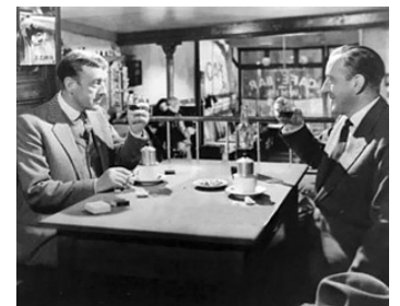
1959 LE BOUC-ÉMISSAIRE (The Scapegoat) de Robert Hamer avec Alec Guinness