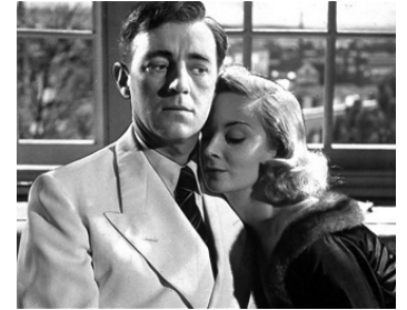
1951 L'HOMME AU COMPLET BLANC (The Man in the white suit) d'A. Mackendrick avec Joan Greenwood