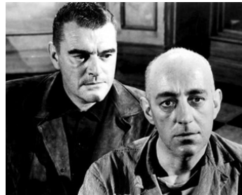
1954 L'EMPRISONNÉ (The Prisoner) de Peter Glenville avec Jack Hawkins