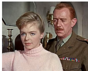
1960 LES FANFARES DE LA GLOIRE (Tunes of Glory) de Ronald Neame avec Susannah York