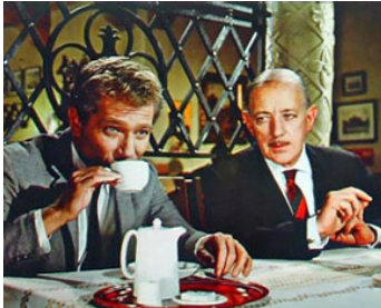
1965 LE SECRET DU RAPPORT QUILLER (The Quiller memorandum) de M. Anderson avec George Segal