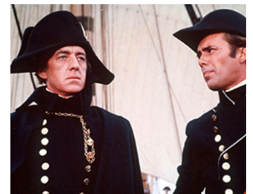
1962 LES MUTINÉS DU TÊMÉRAIRE (H.M.S. Defiant) de Lewis Gilbert avec Dirk Bogarde