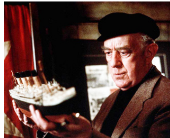
1980 LA GUERRE DES ABÎMES (Raise the Titanic) de Jerry Jameson